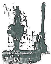
Rynek Fontanna z Neptunem